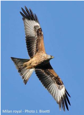
Milan royal

Plus de 10 000 km : c'est la distance que peuvent parcourir les hirondelles, après leur reproduction, pour aller hiverner en Afrique. Comme elles, de nombreuses espèces décident de partir en automne vers des climats plus doux, où les ressources alimentaires seront plus abondantes. Le Défilé de l'Écluse est un site remarquable pour observer ce phénomène de la migration post-nuptiale. Situé en aval du lac Léman, c'est une vallée taillée par le Rhône entre le Grand Crêt d'Eau et le Vuache. Sa topographie forme un couloir naturel pour les oiseaux, et sa proximité avec la grande zone humide de l'Étournal en fait un secteur propice à la halte de nombreuses espèces.